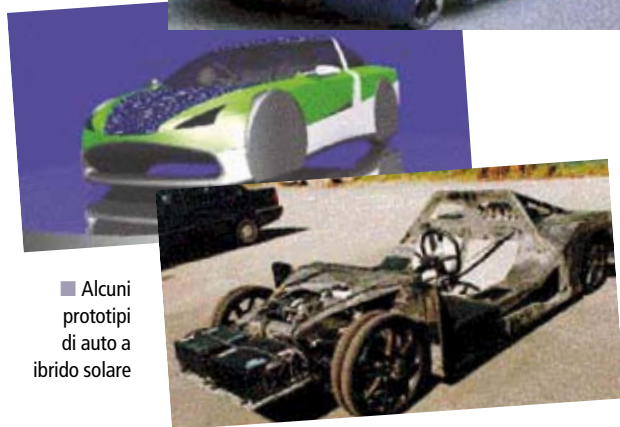
Alcuni prototipi di auto a ibrido solare

Il mezzo che più si avvicina alle necessità dei costruttori è Porter Glass Van della Microvett, un mezzo utilizzato per il trasporto leggero prevalentemente nelle aree urbane e protette, grazie all'assenza di emissioni gassose ed acustiche.